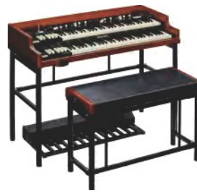
XK-7D STAGE ULTIMATE