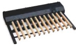
20 Note .811DI Pedalboard xpK-200ci