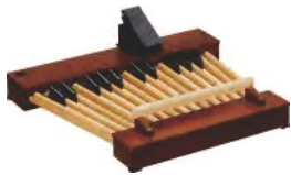
25-More Pedalboard xpK-2s0w in