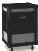
Gonvcn*rn r Hnndks 3500