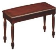
&fiodr Bank BCH-XKD-W