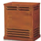
142 Heri rage I42H