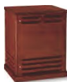
VU nii r Gehäuse 1500T/