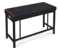
Metal Bench BCH-250XK