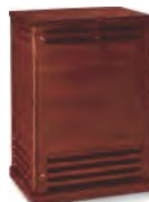
&U nii r Gehäuse 99}