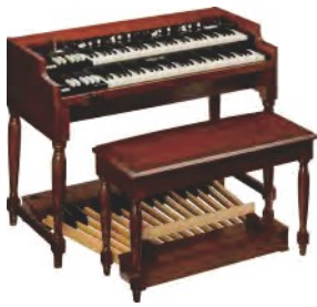
XK-7D CLASSIC ULTIMATE