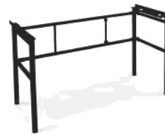
.Sltal Srnd ST-XLK5