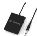
k'oo l Swi lce rS-9H