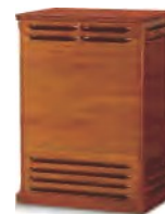
122 Heri rage I22H