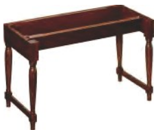
odcn srnd ST-XKD-W