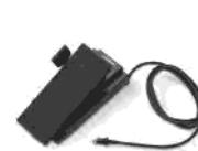
ENpr ssio n Pedad Ext-i oor